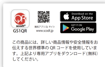
多言語の案内など